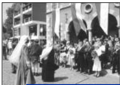
La fête médiévale en centre ville.

Samedi 2 juin dans la matinée : visite aux carrières de cimescaut avec un tir de mine. Impressionnant,