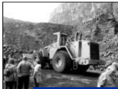
Visite des environs, la carrière.