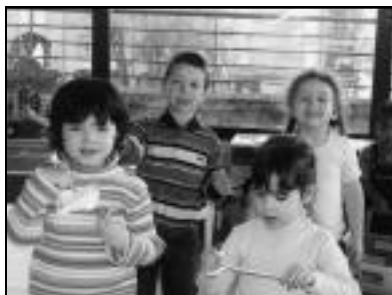
Parents tous les 2 mois, accueil de l'atelier patchwork, accueil de

hiver pour petits et grands, accompagnement scolaire, actions VVV, animation d'un groupe de Paroles de