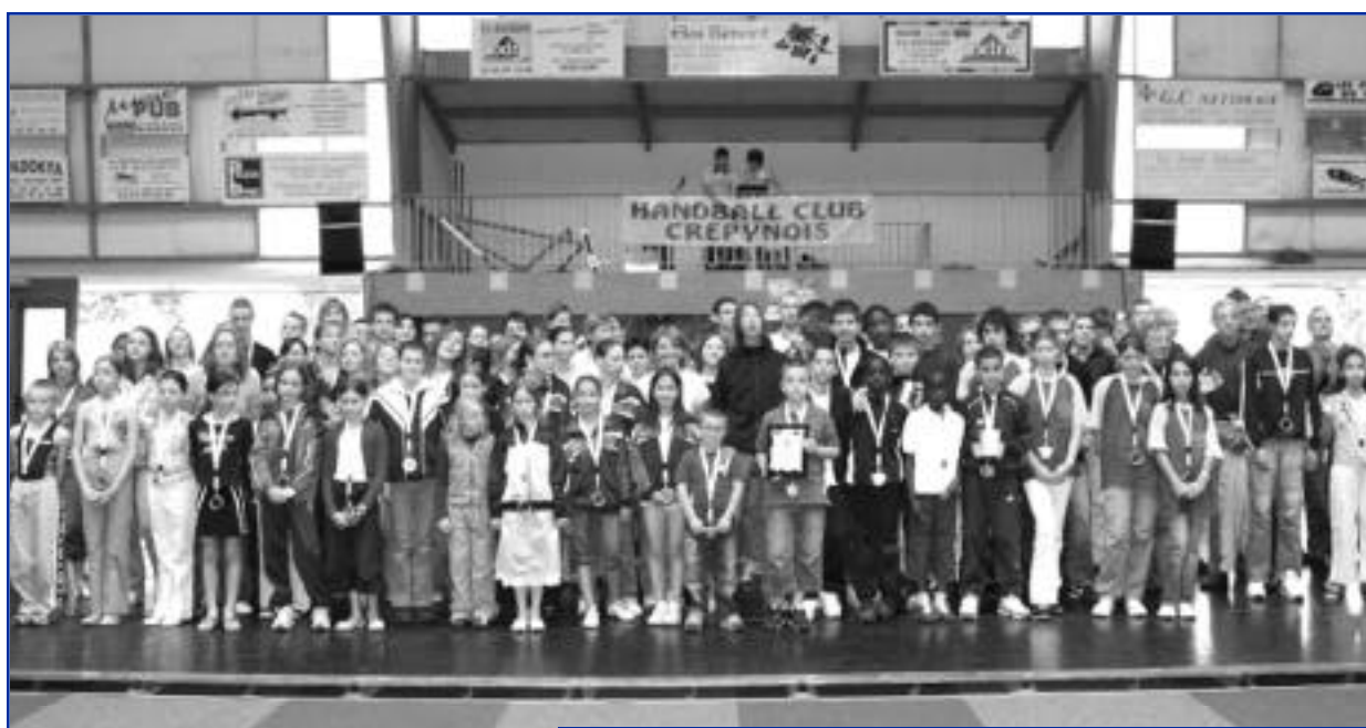
Nos champions ont été récompensés par la municipalité.

Félicitations à tous les sportifs qui ont contribué à porter bien haut les couleurs de Crépy-en-Valois