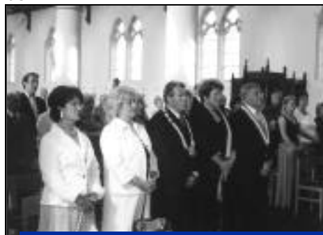
Les 3 représentants des 3 conseils municipaux à l'église d'Antoing.

En 1957, elles remettaient les clefs de leurs villes aux maires lors du premier jumelage. En 2007, elles sont toujours fidèles à ces rencontres au cours desquelles se sont forgées de belles amitiés.