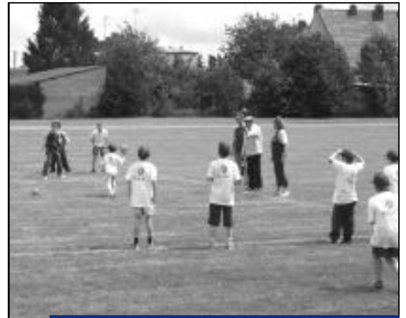
Un moment convivial et de détente entre copains.

Sous un temps un peu nuageux mais avec une bonne humeur plus qu'ensoleillée, nous avons organisé une initiation au dodgeball le samedi 16 juin sur le stade Pie XI à Crépy-en-Valois.