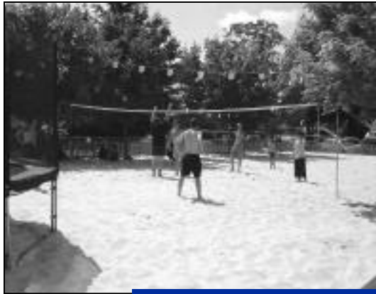
Un moment de détente entre jeunes.

Chaque semaine, une structure gonflable différente ainsi qu'un trampoline seront à la disposition de tous.