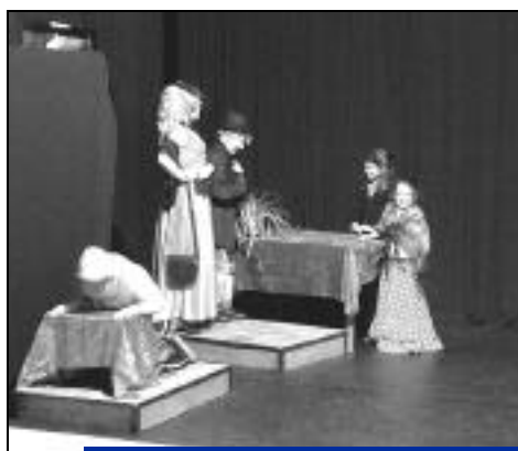
De nombreuses activités vous attendent.

Ces stages seront ouverts à partir de 10 inscriptions avec règlement.