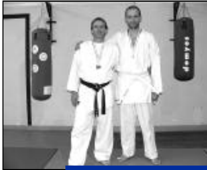
Nos 2 champions à l'honneur.