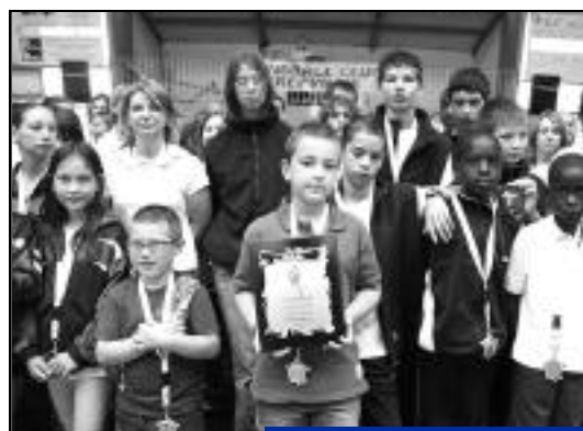
Nos jeunes champions avec leur médaille et trophée.

- le sport c'est l'apprentissage des règles et de la vie collective.