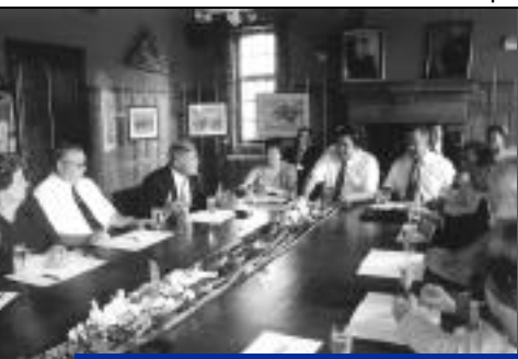
La séance de travail des représentants des 3 conseils municipaux à la mairie d'Antoing.

Restent à souhaiter que ces liens perdurent et que les générations les plus jeunes se passionnent pour ces échanges si enrichissants ! Découvrir l'autre, proche ou lointain, est toujours source de joies partagées. ■