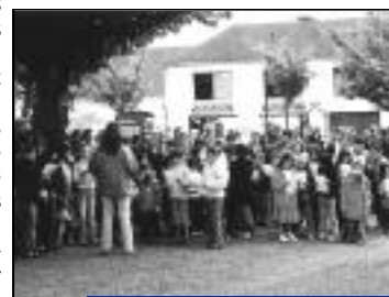
Les enfants des écoles primaires ont entonné le chant des partisans accompagnés par l'Harmonie du Valois.

eux aussi se sentent concernés par cette cérémonie commémorative. Belle démonstration de l'enseignement à retenir et du devoir de mémoire pour le présent et le futur.