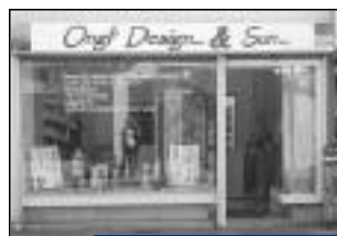
Création - Ongl'Design & Sun Ongles américains, soins des mains 86, rue Nationale.