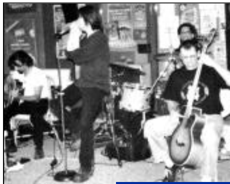
Venez nombreux, il y en aura pour tous les goûts.

Cours du jeu de paume : 22h-24h : Hard Rock avec Mind