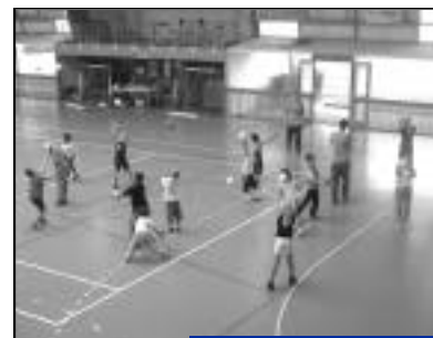
Venez découvrir le handball.

Nous vous attendons nombreux. Pour tout renseignement,