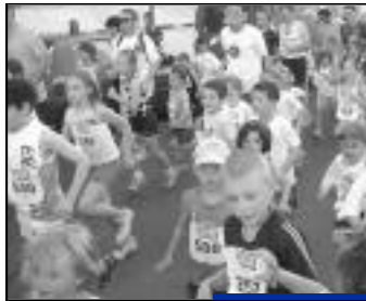
Venez en famille...

Majoration de 2 € pour une inscription sur place, pour les