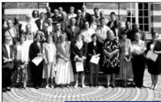
Les médaillés du travail devant le perron de l'Hôtel de Ville.

Entouré d'une partie du conseil municipal, l'occasion était donnée à Pierre Praddaude de rappeler sa vision résolument positive du travail, une des valeurs humaines essentielles, participant activement à l'épanouissement de chacun en permettant d'exprimer pleinement sa créativité et son talent. Le Maire a tenu à préciser