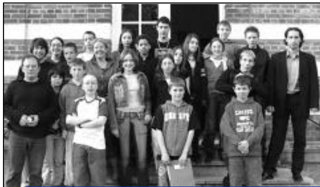
Les jeunes conseillers, le responsable jeunesse et les élus qui suivent le projet.