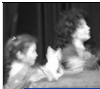
"Stages enfants" du 9 au 13 juillet.

vous ouvrent leurs portes le samedi 2 juin, de 14h30 à 18h.