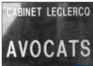
Création Cabinet Leclercq, avocats. 42, rue du Général de Gaulle.

Des nouveaux magasins, des commerçants qui rénovent ou agrandissent leurs boutiques. Nous leur souhaitons la bienvenue et leur adressons tous nos vœux de réussite dans leur activité. Privilégier le commerce local, c'est la meilleure façon de dynamiser notre commune..