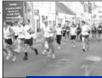
...Pour un moment sportif assuré.

Tirage au sort parmi les arrivants (VT, etc.)