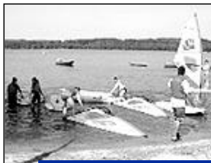
De bons moments entre copains.

Camping - visites - baignades randonnées - grands jeux