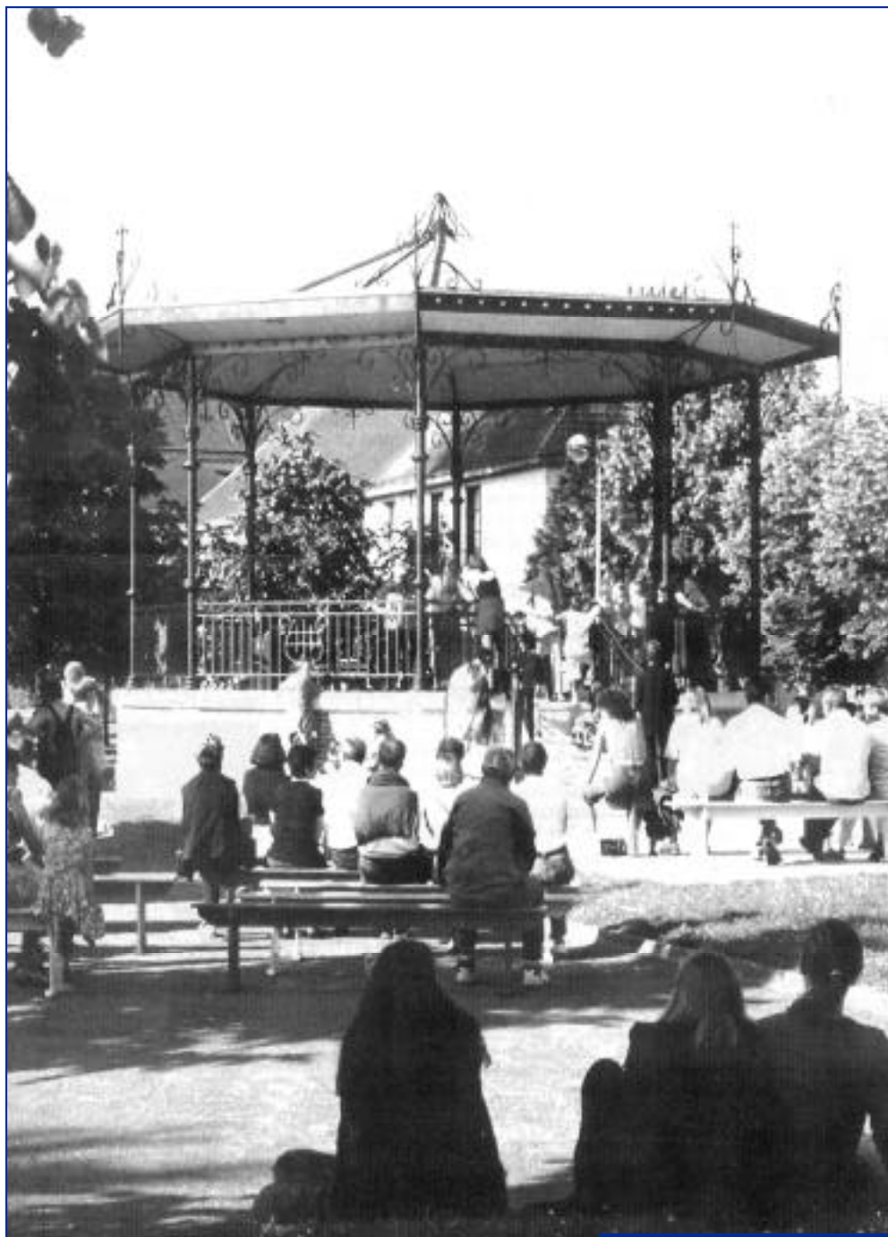
Kiosque à musique, cours Foch.