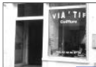
Création Salon de coiffure - Homme, femme 16, rue Thiers.