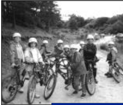
Que feront vos enfants cet été?

Le centre social de la MJC Le Onze et St-Laurent offrent cet été de nombreuses activités aux jeunes de 11 à 17 ans ne pouvant partir en vacances avec une innovation cette année. Les activités à thème seront proposées sous forme d'ateliers à la semaine (sportifs, manuels, artistiques) sans toutefois oublier la nécessité d'effectuer un "petit boulot" d'une semaine en échange de ces loisirs à des tarifs préférentiels. Il sera possible également aux jeunes n'habitant pas Crépy de participer à cette action dans le cadre d'ETE DES JEUNES moyennant une adhésion de 16 € valable les deux mois de l'été et une participation pour