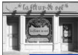
Création - La Fleur de Sel. Restaurant. 14, rue Nationale.