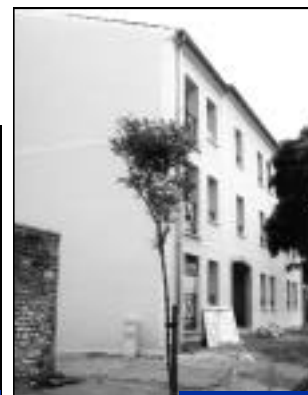
Rue Saint-Lazare. Résidence LDF 10 appartements.