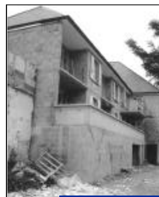
Impasse Belle Image. 10 appartements.