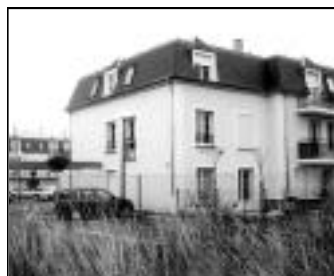
Le Clos des Archers - Rue Henri Laroche. 14 maisons - 30 appartements.