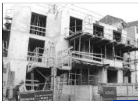
Rue de Vez. Résidence de la Tour de Vez. 7 appartements.