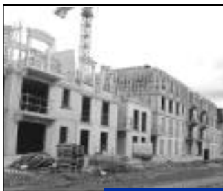
Allée des Lys du Valois. 82 logements.