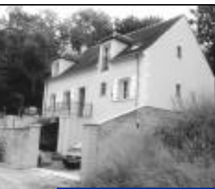
Plusieurs maisons individuelles dans divers quartiers.