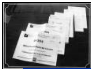
Le dossier des préétudes a été transmis au ministre des transports.

Lors de la cérémonie de commémoration de la disparition des 44 enfants du Valois il y a 25 ans, j'ai terminé mon allocution comme chaque année en demandant à l'Etat la suppression des graves risques de circulation liés à la traversée de Crépy-en-Valois et des communes avoisinantes par 1.000 camions chaque jour. Monsieur le Ministre des