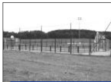
Plusieurs disciplines pourront être pratiquées (basket, hand, tennis, volley).

La revue 2007-2008 de l'U.S.C. paraît cette année dès septembre pour vous présenter l'offre en sport de ses associations adhérentes. Elle est disponible dans de nombreux lieux publics : service des sports, mairie, bibliothèque, MJC, salles d'attente, OT, commerçants.