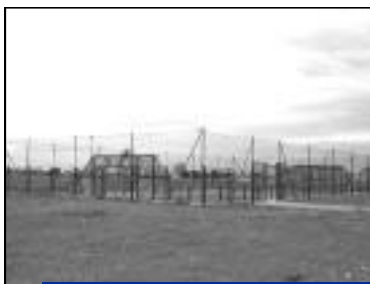
Nouvelles installations sportives implantées rue des Chênes.

Un nouvel équipement de proximité est venu accompagner les installations sportives de la ville. Financé par le Conseil général de l'Oise et l'apport gracieux du terrain par la Ville de Crépy en Valois, cet équipement implanté rue des Chênes (quartier Campus) permet de pratiquer une discipline (basket, hand, tennis, volley) dans une enceinte fermée dont les limites sont tracées sur un terrain à base de moquette et sable.