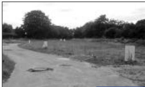
Placette des Glaïeuls. 5 futures maisons.