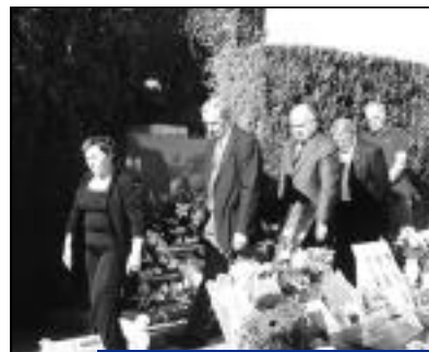
Moment de recueillement au cimetière d'Hazemont.

J'ai vu depuis 1995, ici, un ministre des transports, de nombreux élus locaux et nationaux, plusieurs Préfets et Sous-préfets. Avec le Président et la Présidente de l'Association des Victimes des Transports, j'ai fait appel à tous ces grands décideurs pour obtenir cette déviation.