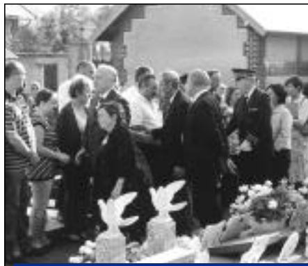
Moment d'émotion lors de l'arrivée des personnalités.

1997 sont tombés dans l'oubli depuis 2004 malgré la forte croissance du transport routier.