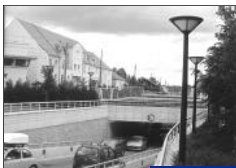
Avenue Levallois-Perret. Résidence de l'Horloge. 25 appartements.