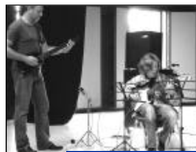
"Cours guitare ados ou enfants".

En 1 ère partie, "Y MAO", jeune groupe pop-rock.