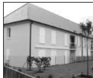
Rue Faidherbe 36 appartements.