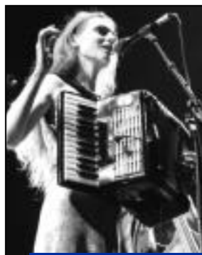
"Concert musique du monde".

- découpage - peinture sur soie le mardi après-midi