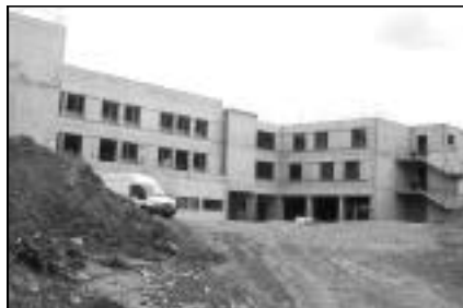
Maison de retraite "La sagesse" Rue des Érables. 45 logements.

Voici quelques photos prises au hasard d'un circuit en ville. Décidément, le P.L.U. 2020 est déjà en route.