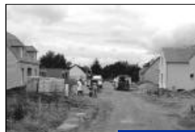
Quartier des fleurs. Rue des Coquelicots, rue des Narcisses, rue des Martyrs - 39 maisons.