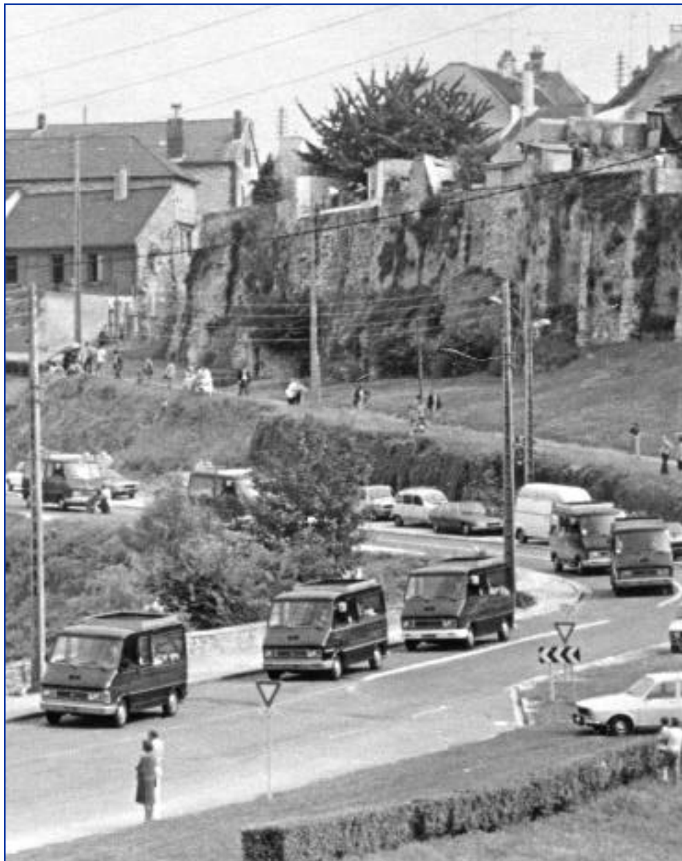
Le cortège impressionnant de quarante-quatre corbillards se rendant au cimetière d'Hazemont en août 1982 aura marqué les esprits.

Pierre PRADDAUDE Maire de Crépy-en-Valois.