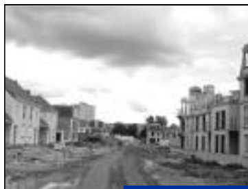
Allée des Lys du Valois. 62 maisons.