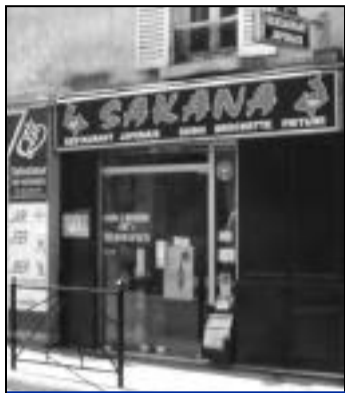
Pour se restaurer façon exotique : Sakana avec ses spécialités de cuisine japonaise rue Charles de Gaulle.

Plusieurs commerçants ont ouverts les portes de leur nouveau magasin ces dernières semaines dans le centre-ville de Crépy-en-Valois.