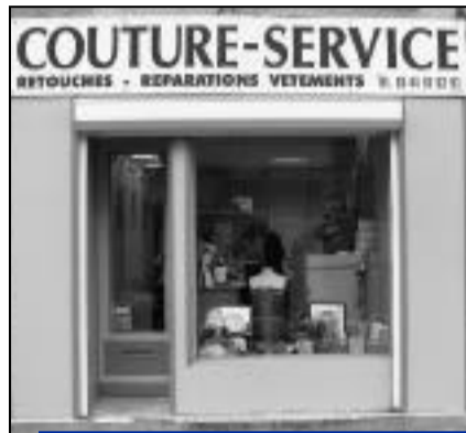
Au 33 rue Thiers, Couture Service, une boutique de couture, broderie, retouche, confection, ameublement...