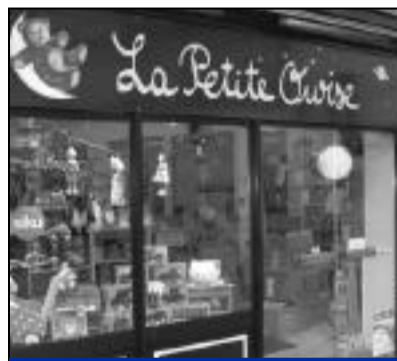
La Petite Ourse 50, rue Charles de Gaulle, rassemble jeux et jouets traditionnels pour enfants et des livres jeunesse.