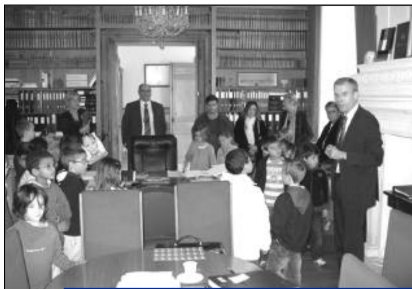
Le 13 novembre, les élèves de primaire de la classe de Madame Zanga, de l'école André Malraux, ont visité la mairie pour un cours d'éducation civique interactif en compagnie des élus.