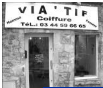
Via'tif, coiffeur mixte au 32, rue Saint-Lazare.