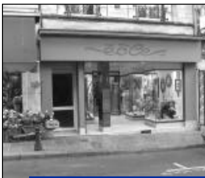
Eole, 30 rue Nationale, propose des cadeaux, bijoux, montres, katanas, objets égyptiens et autres pendules.