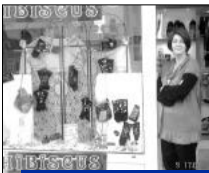
Hibiscus, au 34 rue Charles de Gaulle, vend des bijoux fantaisie et des accessoires.