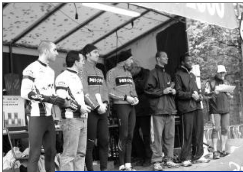
Le 9 novembre, les champions de la compétition du run and bike sur le podium. Bravo les sportifs !