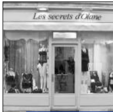
Les secrets d'Olane situé 7, rue Charles de Gaulle est un nouveau magasin de lingerie.