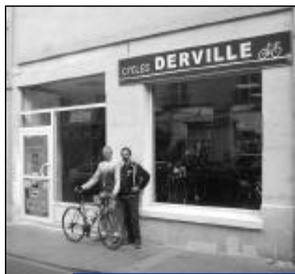
Quant aux Cycles Dervillé, ils ont agrandi et totalement rénové leur commerce de vente et réparation de cycles qui se situe toujours au 5 rue Charles de Gaulle.

Elle reprendra au printemps, à partir du 23 mars 2009, tous les mercredis. D'autre part, les Crépynois recevront bientôt dans leur boîte aux lettres le calendrier 2009 avec le programme complet des collectes de déchets.