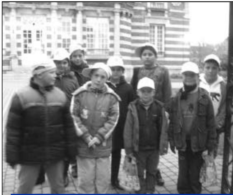
Le 29 octobre, 15 jeunes Crépynois ont pu profiter d'une sortie au Parc Astérix à l'invitation du Conseil régional de Picardie. Une action à laquelle le CCAS de Crépy-en-Valois participe depuis 10 ans.