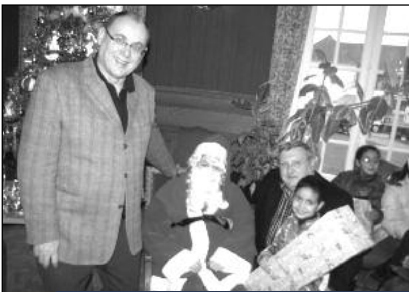
Parce que Noël doit être une fête pour tous, la municipalité a demandé au Père Noël de bien faire attention de n'oublier personne. 80 enfants ont pu bénéficier de cette générosité !