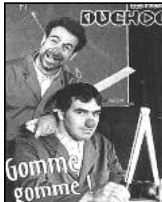
Ne manquez pas ce spectacle plein de poésie et d'humour.

Samedi 17 janvier à 15h30, la MJC accueille les Frères Duchoc à l'espace Rameau. Ces 2 humoristes présentent un spectacle musical "Gomme, Gomme" pour petits et grands à partir de 5 ans. Les 2 comédiens incarnent les pitres qui chahutent dès que l'instituteur a le dos tourné. Par leur gestuelle, l'expressivité de leur visage, les situations grotesques qu'ils créent, nos deux clowns percussionnistes provoquent les rires et enchaînent les rythmes en détournant les objets pour faire résonner les sons.