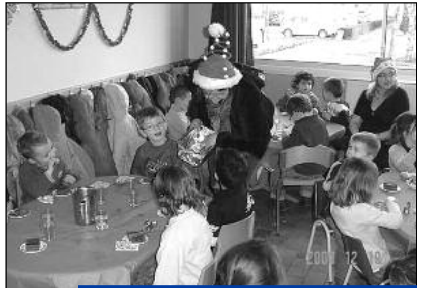
Pour fêter Noël avec les copains, repas de fête au restaurant scolaire pour les petits... et les grands !