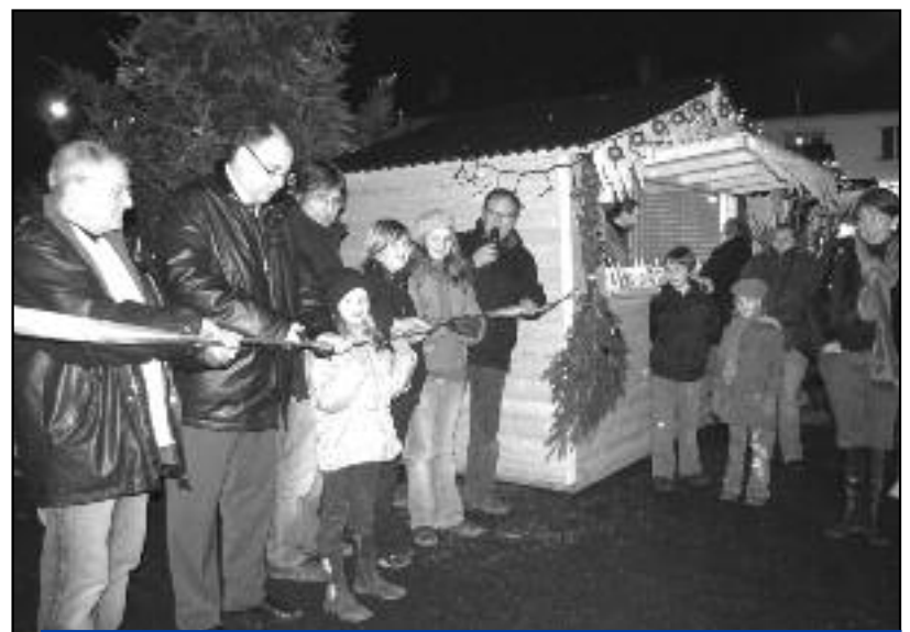
Cette année, ce n'est pas seulement la traditionnelle patinoire de Noël qui a été inaugurée. Pour la première fois, entre deux séances de glissade, les Crépynois ont aussi pu profiter d'un marché de Noël.