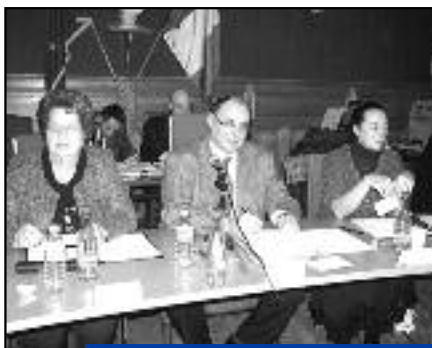
Le maire a présenté le projet lors du dernier conseil municipal.

système d'occupation anticipé, approuvé par tous, a été choisi. Rappelons que l'aménagement du