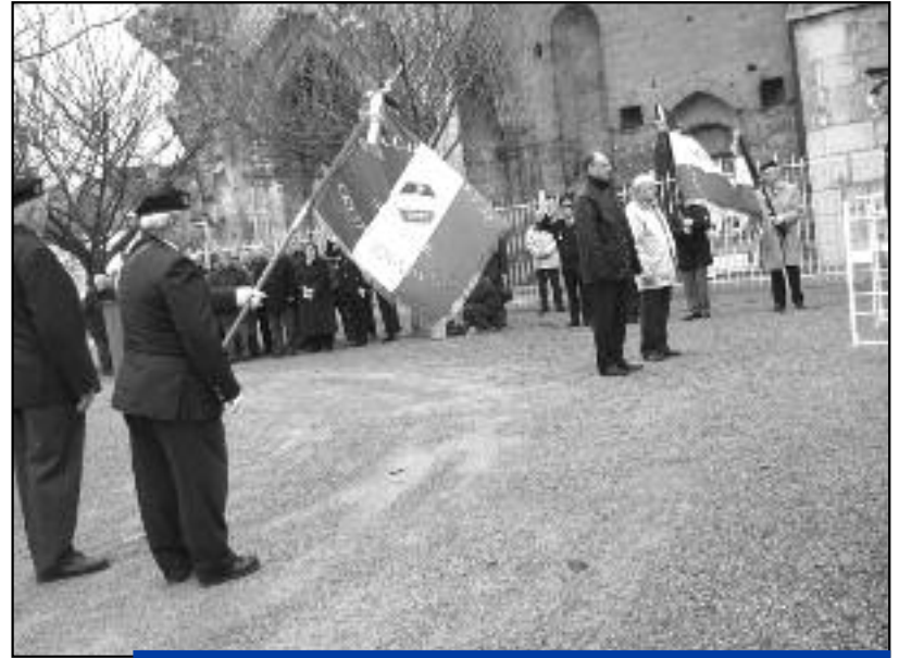
Le 5 décembre, les anciens combattants prisonniers de guerre-combattants Algérie Tunisie Maroc (ACPG – CATM) et la municipalité se sont rassemblés devant les Monument aux Morts pour la journée nationale d'hommage.