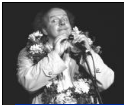
"Théâtre humoristique le 9 novembre"

Un évènement va bouleverser leur existence : la découverte par Lilian d'une lampe magique.