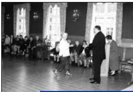
La remise des récompenses par les élus.