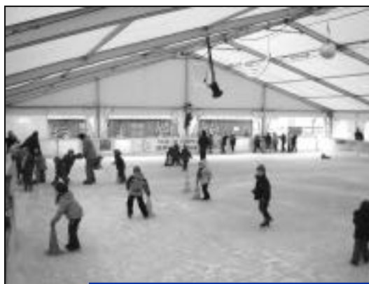
Du hockey sera proposé aux plus sportifs.

Comme l'an passé, une surface de patinage de 500 m 2 ,