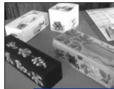
Faites-vous plaisir utilement !

moyens techniques pour l'organisation ainsi que tous les Crépynois qui sont venus nombreux à ce rendez-vous.