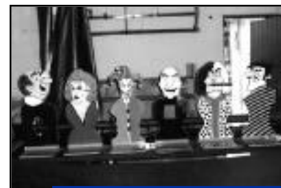
Le nouveau jeu le "claque misère".

Les sommes collectées lors de cette vente seront reversées dans la caisse du téléthon.