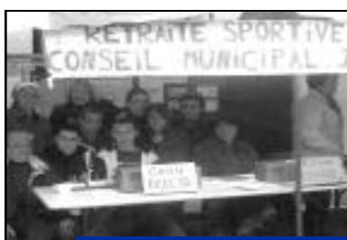
Tous réunis pour le Téléthon !

Ils vous attendront place Michel Dupuy avec des marches surprises et des jeux le samedi et le dimanche. A côté du jeu de palet picard déjà connu, un nouveau jeu, (conçu par les jeunes,