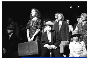
"Les Terres Fortes", spectacle sur l'histoire de la culture des betteraves.