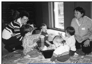
Dans une ambiance apaisante et détendue.

Ces expériences ont permis à l'enfant d'aiguiser sa curiosité et