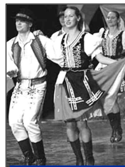
Concert folklorique, le dimanche.