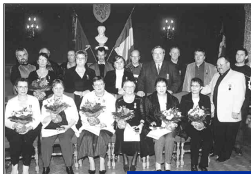
Les médaillés du nouvel an.