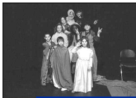
"Poterie-théâtre autour de la création d'un conte."