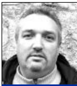
Pierre-Marie Jumeaucourt Quartier Ramon.