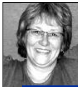
Florence Harmant Quartier Péguy.