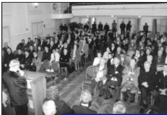
Les personnalités locales très attentives aux vœux de la municipalité.

Avant de conclure son intervention, le Maire a formulé un dernier vœu, non pas un vœu pour