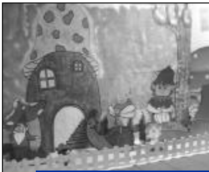
Un bon moment de détente assuré.