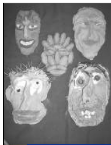
Masques "stage ados musique masques imaginaires".

Ouverture du stage à partir de 4 inscriptions.