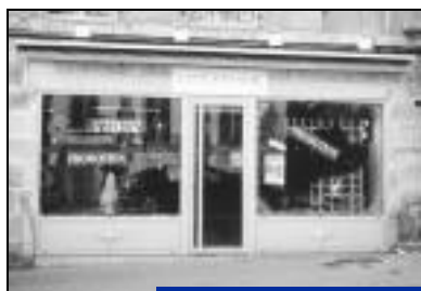
Création - 100% Femmes Prêt à porter féminin 34, rue Charles de Gaulle.

Des nouveaux magasins, des commerçants qui rénovent ou agrandissent leurs boutiques. Nous leur souhaitons la bienvenue et leur adressons tous nos vœux de réussite dans leur activité. Privilégier le commerce local, c'est la meilleure façon de dynamiser notre commune.