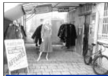
Création - Au petit bonheur. Dépôt-vente Vêtements, accessoires, bijoux, jouets, PC, etc. 25, rue Charles de Gaulle.