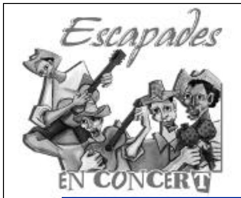
"Escapades" concert de Patrick Villain.

Courriel : mjcespaceurope@wanadoo.fr Horaires de l'accueil en période scolaire : du lundi au vend de 9h à 12h, de 14h à 19h ; le samedi de 13h30 à 17h.