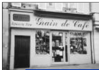
Changement de propriétaire. Grain de café - Epicerie fines. 39, rue Nationale.