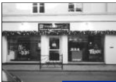
Création - Orange. Opérateur téléphonique. 1, rue Charles de Gaulle.