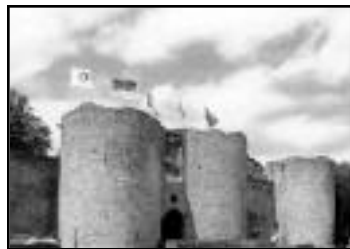
"PERONNE : histoire et nature". Mardi 18 mars 2008

L'enfant doit être obligatoirement accompagné par un adulte-majeur (autorisation parentale si l'enfant est confié à une autre personne).