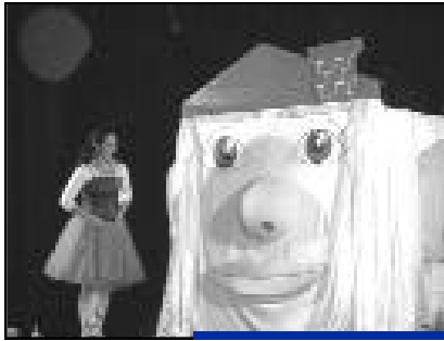
La maison bonhomme.

Le mercredi 12 décembre a eu lieu le spectacle de Noël pour les enfants fréquentant les structures d'accueil du Centre Communal d'Actions Sociales. L'enchantement du spectacle a été possible grâce au Centre de Création et de Diffusion Musicale, financé par le CCAS. Cette compagnie a joué "La maison bonhomme". Bulle et Citronnelle ont éveillé un à un les sens de la maison en chantant : "ding ding ding, toc toc toc, tournez le bouton, entrez dans la maison". La Crèche Familiale, la Halte Jeux, le Relais Assistantes Maternelles, la Ludothèque et l'Accueil de Loisir des Jeunes ont organisé cette journées très