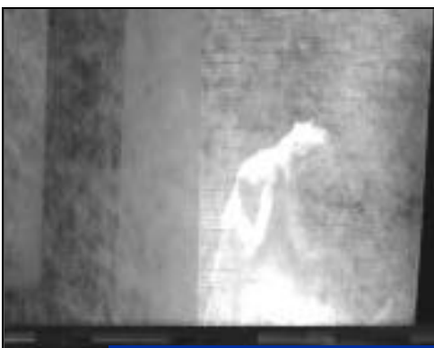
"Neige", théâtre poétique et musical.

Au Japon du XIX ème siècle, Yuko s'adonne à l'art du haïku. Portant un amour particulier à la neige, ses vers sont magnifiques mais