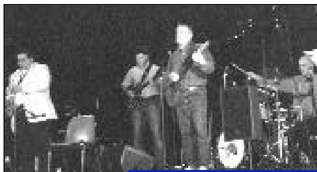
"Escapades", concert chanson française.

Cette technique de la peinture au couteau utilise la pâte pour donner une texture tout en relief accrochant la lumière.