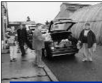
Plus de 2000 colis offerts par le Centre Communal d'Actions Sociales de la Mairie ont été distribués à nos anciens par des dizaines d'amis bénévoles