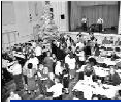
Plus de 300 personnes ont participé dans la bonne humeur et la convivialité à un après-midi dansant, à la salle des fêtes, pour le goûter des anciens.

Une façon de se sentir utile et de donner un peu de bonheur autour de soi en ces périodes de fêtes.