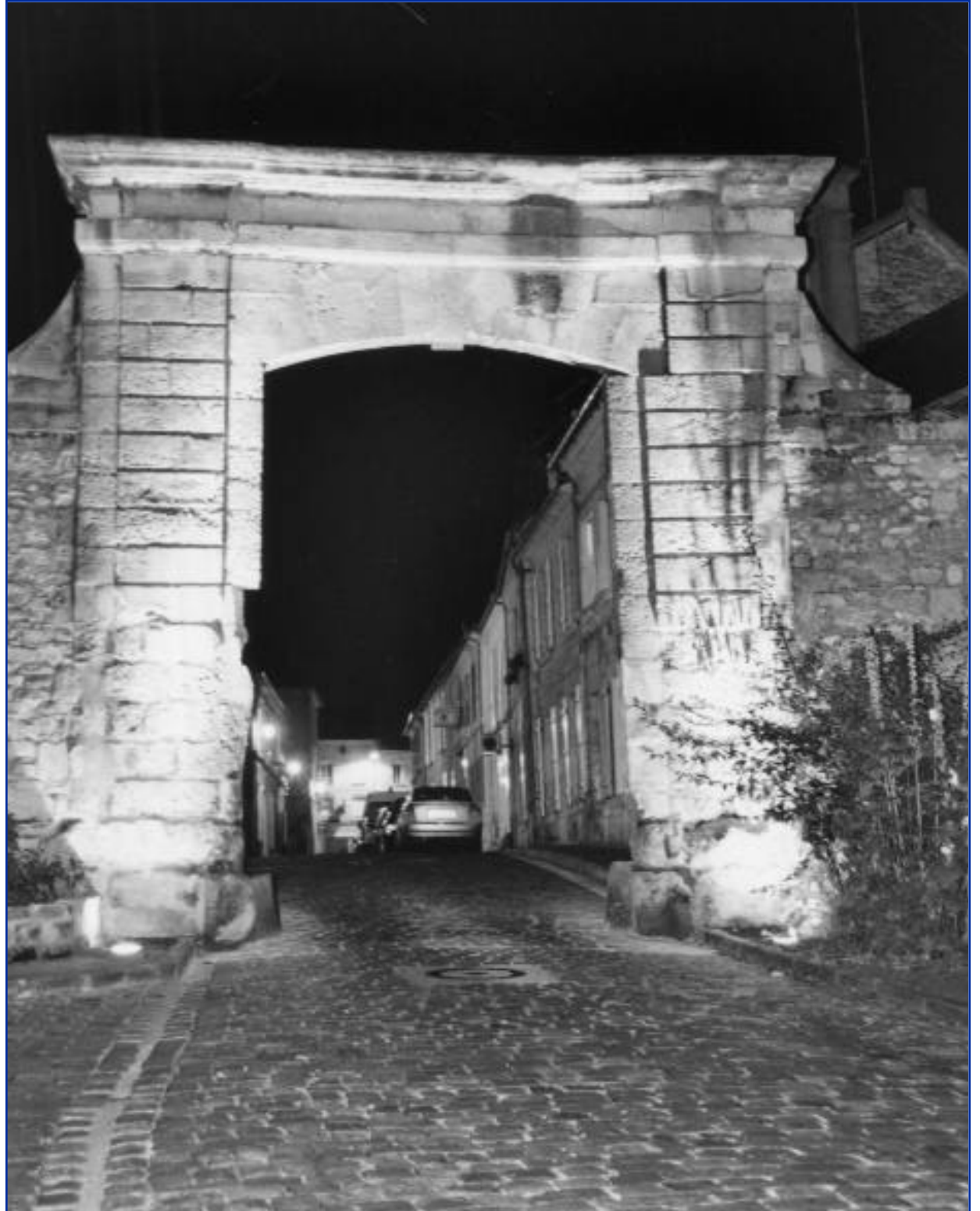
La Porte Sainte Agathe - Dans le vieux Crépy, le visiteur prend plaisir à flâner et à retrouver le charme discret du passé.