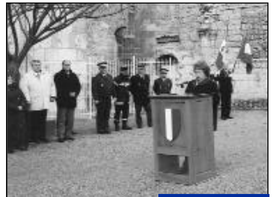
Le devoir de mémoire.