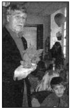
Des chocolats ont été distribués aux scolaires dans les cantines à l'occasion du repas de Noël des écoles crépynoises.