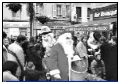
Un Père Noël invité par Crépy Animations a distribué dans les rues de notre ville des friandises et des tickets pour un tour de manège gratuit.