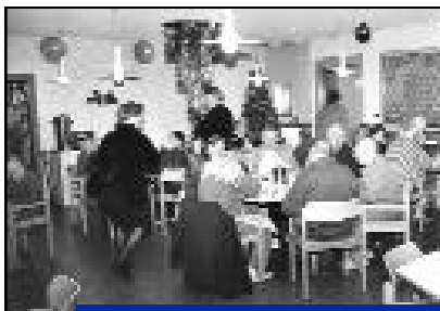
Une équipe d'élus a rendu visite aux résidents des maisons de retraite de la Hante, des Primevères ou hospitalisés à Saint-Lazare. Tous ont reçu des cadeaux offerts par la municipalité.