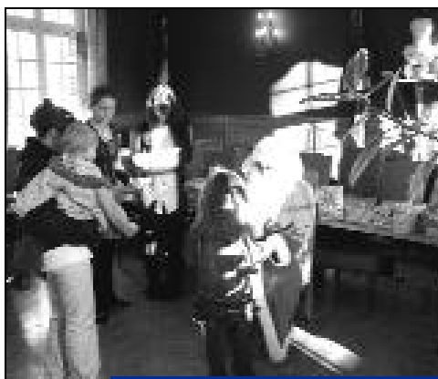
Remise des cadeaux par le père Noël.

Le CCAS de la ville de Crépy-en-Valois a fait venir le père Noël en Mairie pour une distribution de jouets aux familles en difficultés.