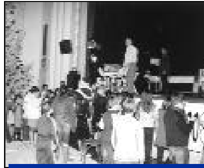
Un arbre de Noël a été organisé par l'amicale du personnel communal pour tous les enfants des employés communaux avec au programme : spectacle, goûter et distribution des jouets.