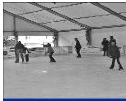
Pour la 4 ème année consécutive, la patinoire a permis à plusieurs milliers de personnes, dont les scolaires, de passer un moment de détente dans la convivialité.