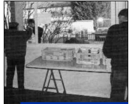
Le C.C.A.S. organise pendant les mois d'hiver, une distribution de repas de précarité pour les personnes les plus démunies.