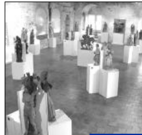
Musée d'art sacré.

La rencontre entre le photographe Robin et le musée de Crépy se fait sous l'égide de saint Sébastien. Le musée possède en effet une belle