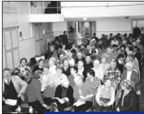
Les adhérents venus nombreux pour cette assemblée générale.

M. le Maire nous rappelle l'intérêt que la commune porte aux associations Crépynoises et en particulier la Retraite Sportive, Monsieur Paul nous fait état des