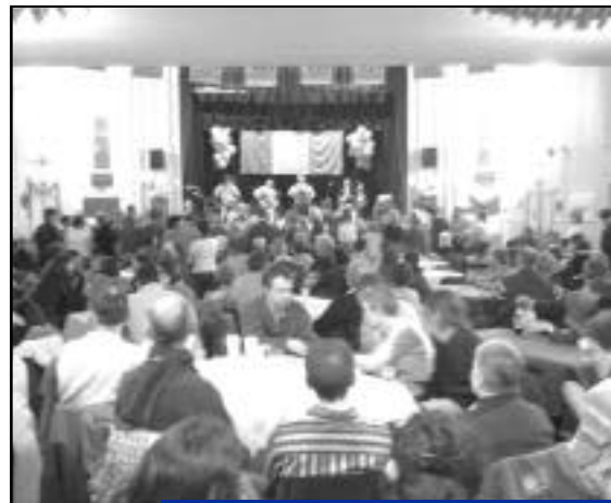
Venez nombreux pour cette soirée festive.

Celui-ci sera animé par une danseuse qui vous apprendra les pas afin que vous puissiez vous aussi participer.