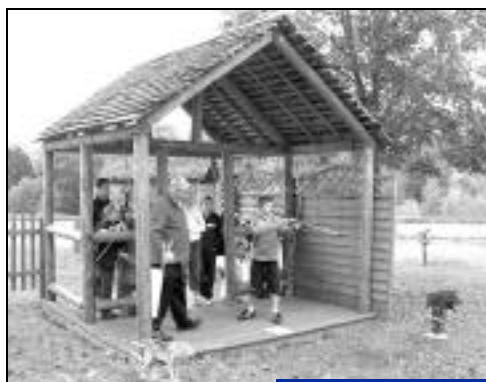
Initiation au tir à l'arc.

Musée de l'archerie et du Valois Rue Gustave Chopinet 60800 Crépy-en-Valois 03 44 59 21 97 musee-mairie-crepy-en-valois@wanadoo.fr