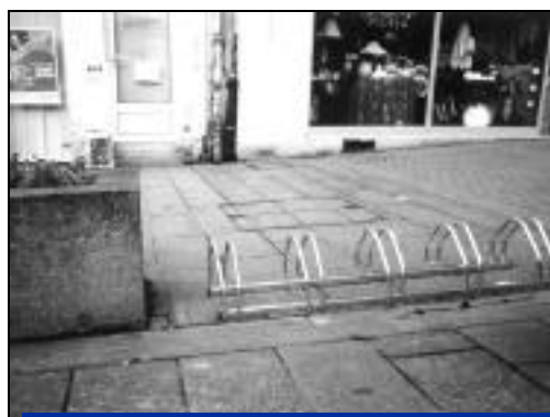
Rue Nationale à proximité du magasin "Cancan".

Les côtes sont rares en ville donc il ne faut pas hésiter à utiliser le vélo ; cela ne pollue pas ; c'est bon pour le cœur et les genoux et il n'y a pas