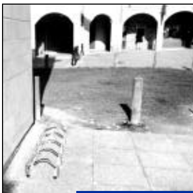
Devant la bibliothèque.

Déjà 8 installations sont terminées : rue Gaston d'Orléans face à la poste,