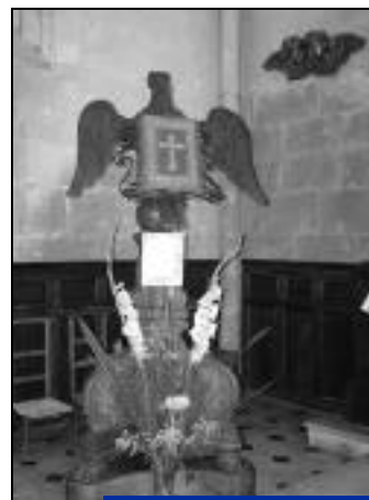
Lutrin de l'église St-Denis.

A découvrir jusqu'au 2 novembre, à l'Office de Tourisme.