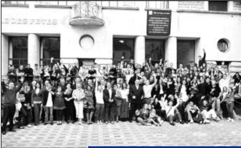
6 septembre, la municipalité récompense ses bacheliers.