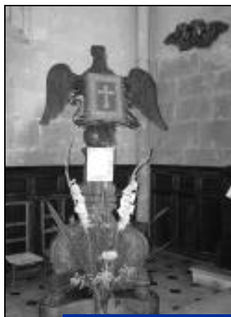
Lutrin de l'église St-Denis.

A découvrir jusqu'au 2 novembre, à l'Office de Tourisme.