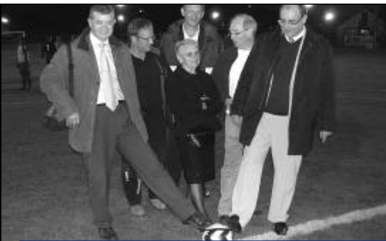
24 septembre, inauguration de l'éclairage du stade d'honneur de football.