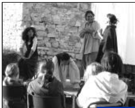
Le vilain mire.

L'Office de Tourisme de Crépy-en-Valois et de la Vallée de l'Automne remercie vivement toutes les