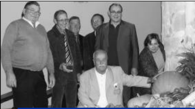
13 septembre, jardins familiaux, messe Saint Fiacre, Église de bouillant.