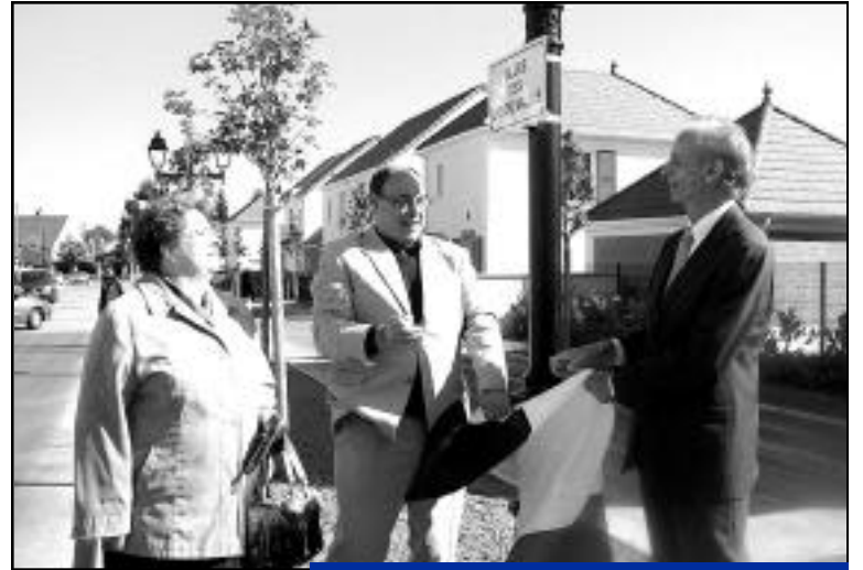
20 septembre, inauguration allée des Lys du Valois.