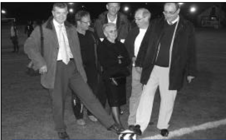
24 septembre, inauguration de l'éclairage du stade d'honneur de football.