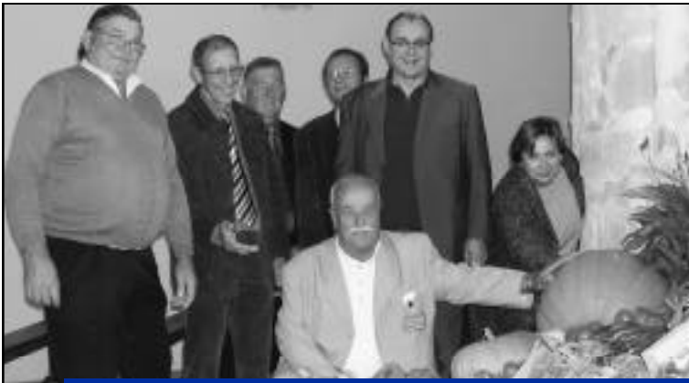
13 septembre, jardins familiaux, messe Saint Fiacre, Église de bouillant.