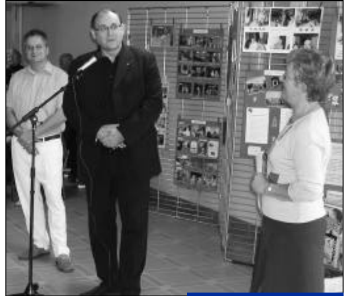
12 septembre, 20 ans des VMEH.