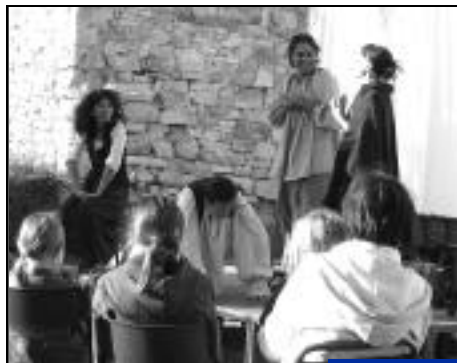
Le vilain mire.

L'Office de Tourisme de Crépy-en-Valois et de la Vallée de l'Automne remercie vivement toutes les