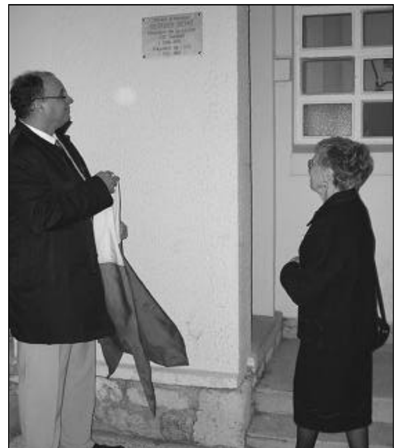
24 septembre, inauguration du stade municipal Georges Detré.