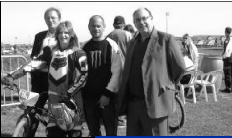
13 septembre, BMX championnat de picardie.