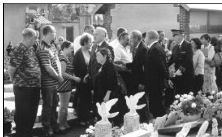
31 juillet, cimetière d'Hazemont, cérémonie de Beaune.