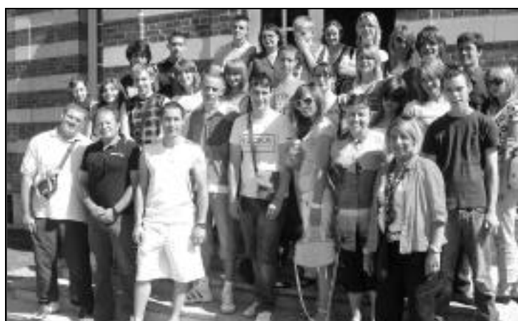
Accueil de jeunes de Plonsk, 1 ère semaine de juillet.