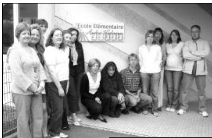
Nouvelle signalétique école Malraux.