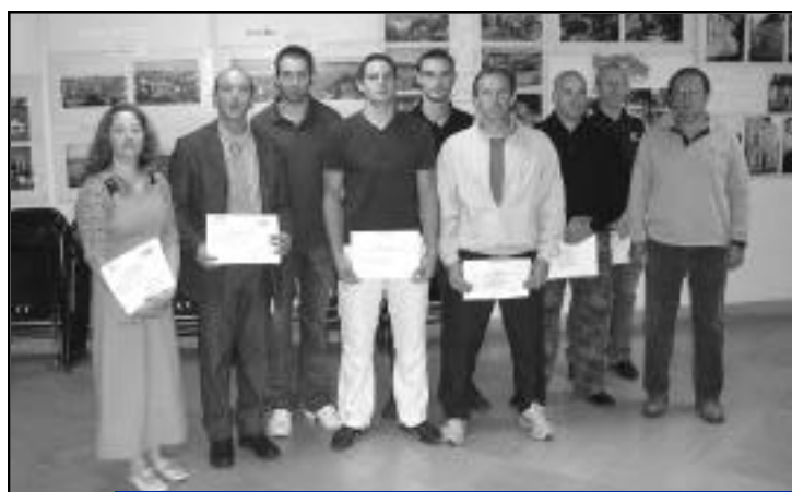
5 Juillet, remise des diplômes de sécurité et sauvetage aquatique