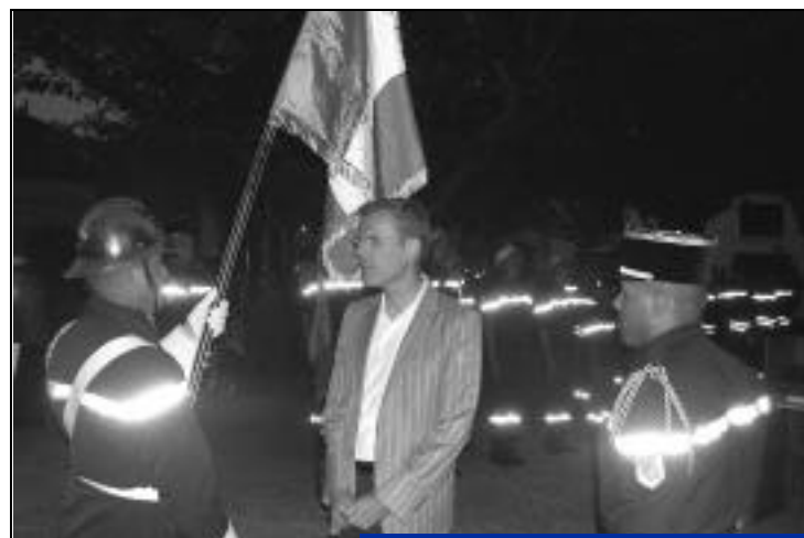
13 juillet remise d'un drapeau au président de l'Amicale des Sapeurs-Pompiers.