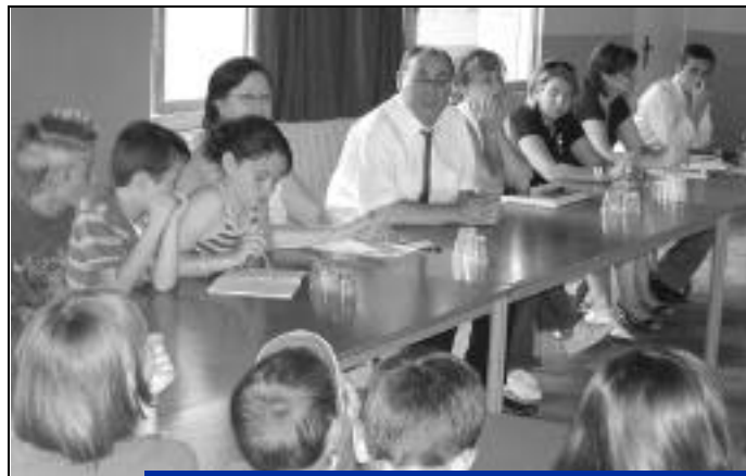
24 juin, restaurant scolaire Massenet, comment améliorer encore le temps de restauration.