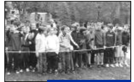
Merci pour cette solidarité.

Elle servira notamment à acheter des jouets de Noël pour les enfants des familles défavorisées.