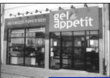
Création - Gel appétit Produits surgelés. Place de la République.