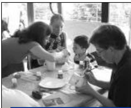
Venez préparer vos décorations de Noël.