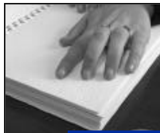
Initiation au braille.

La MJC Espace culturel ouvre à partir de janvier un atelier d'initiation gratuite au braille pour adultes et adolescents voyants, en partenariat avec "Handicap et Citoyenneté à Crépy".