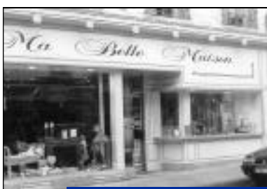
Changement de propriétaire. Ma Belle Maison - Arts de la table 19, rue Nationale.