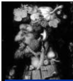
Œuvre du peintre Arcimboldo

Encore quelques jours pour découvrir ou redécouvrir l'exposition "Rêverie" de Jean-Luc VANKERSSCHAUER. A voir à l'Office de Tourisme jusqu'au 15 décembre !