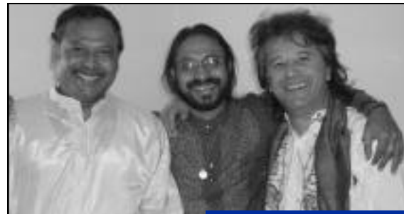
Musique et danse indiennes.

conversation entre trois personnages hors normes, tant sur le plan musical qu'humain. Ce concert sera accompagné de gracieuses danses indiennes. Première partie de la soirée, de 19 heures à 20 heures, gratuite. Tarifs du concert à 20h30 : normal 12 euros, réduit 9 euros, groupe 7 euros.