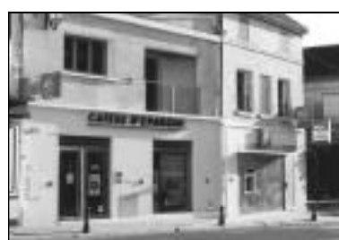
Création Caisse d'épargne - Banque. 25, rue Charles de Gaulle.