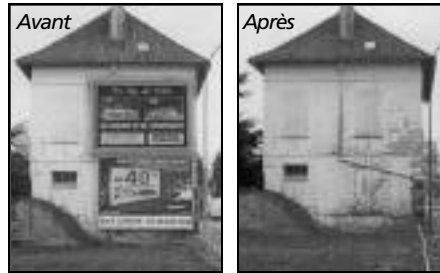
Boulevard Victor Hugo

(Sous-préfet, DDE, Architecte des Bâtiments de France, Gendarmerie...), des représentants des Chambres consulaires, des entreprises de publicité extérieure et des fabricants d'enseignes. De nombreuses réunions ont eu lieu et ont abouti à un projet que le Préfet a soumis à la commission départementale des sites pour avis.