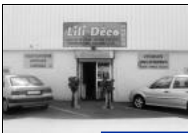
Création - Lili déco Linge de maison, fleurs, textile, cadeaux. 27, avenue Pasteur.