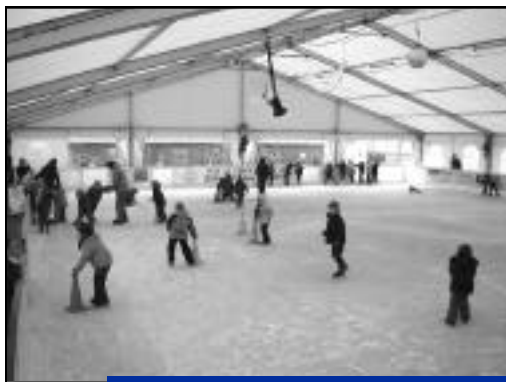
Du hockey sera proposé aux plus sportifs.

Une fois fini le tour des illuminations et des vitrines de Noël, une fois les cadeaux choisis, profitez des soirées d'hiver pour faire du sport à la patinoire, place de la République.