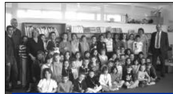
20 mai : remise de la médaille de la ville aux élèves de l'école Ramon vainqueurs de la rencontre scolaire de hand-ball.