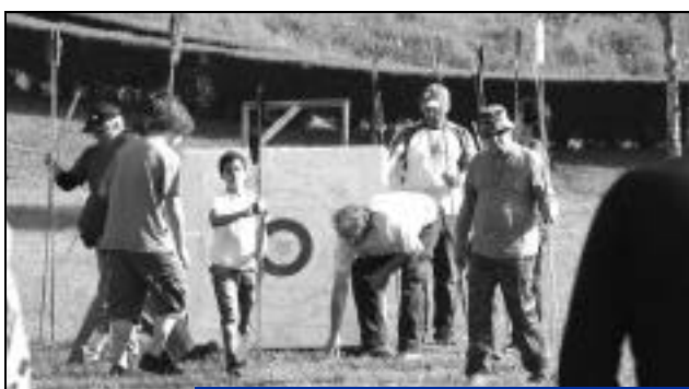
3 et 4 mai : manche du championnat européen de tir aux armes préhistoriques.