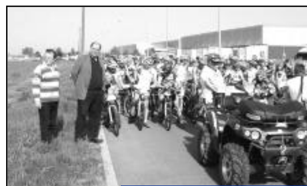
4 mai : départ du 1 er raid picard en VTT.