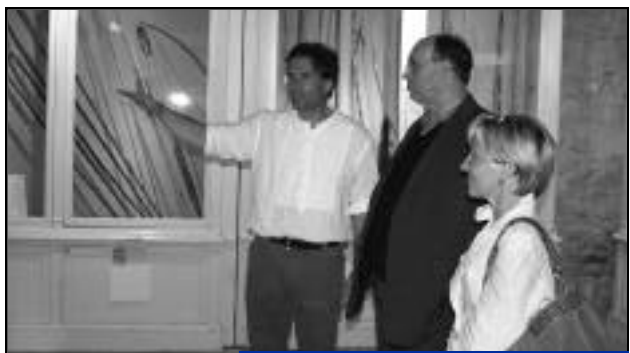
17 mai : ouverture de la nuit des musées.