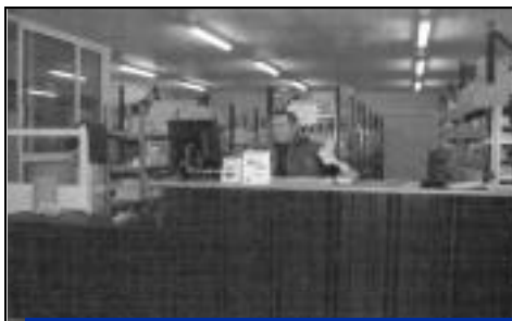
Agrandissement - Escale Auto - Casse auto nouvelle norme VHU (véhicules hors d'usage) - Route de Pierrefonds.