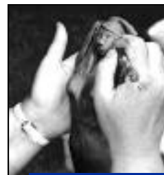
Atelier poterie céramique pour ados et adultes.

Europe des ateliers poterie-céramique pour adolescents et adultes. Ateliers les vendredis de