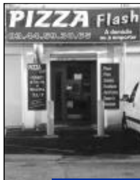
Changement d'adresse Pizza Flash - 27, avenue Pasteur.