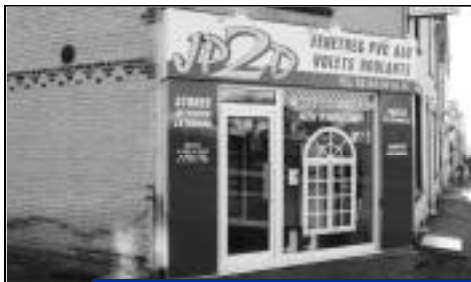
Création - JP2D - Fenêtres pvc, alu, volets roulants 3, avenue Pasteur.