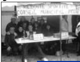
Nous vous remercions pour votre participation.

Les jeunes du Conseil Municipal et les anciens de la Retraite Sportive ont généreusement travaillé ensemble afin de dépasser leur dur challenge de 1500 €. Les marches et les jeux de palets picards ont eu un franc succès ; c'est ainsi que nous avons pu remettre un chèque de 1504,10 € au profit du Téléthon.