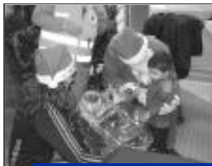
Quel instant émouvant que la remise des jouets par le Père Noël.

Le mercredi 20 décembre dernier, deux classes BTS secrétariat et comptabilité du Lycée Robert Desnos de Crépy-en-Valois, la Croix Rouge, le Secours Catholique et le CCAS de la ville de Crépy-en-Valois étaient associés dans une action conjointe de distribution de jouets au bénéfice d'enfants de familles défavorisées.