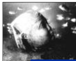
Trésors engloutis d'Égypte.