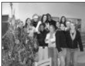
Félicitations aux étudiants (es) du Lycée Robert Desnos pour cette action méritante.

remise de jouets. Les élèves ont également voulu associer les deux familles qui ont eu leur appartement détruit par le feu récemment.