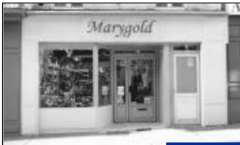
Création - Marygold - Produits anglais 29, rue Nationale.