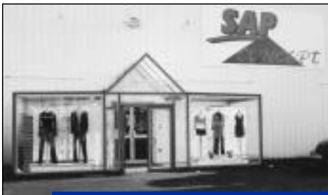
Agrandissement - SAP Concept - Vente de vêtements Femme, homme, enfants - 21, avenue Pasteur.