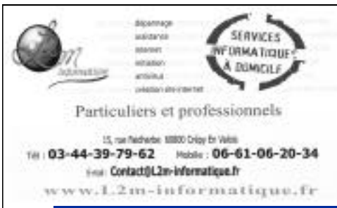
Création - L2m Informatique - Services informatiques à domicile - 15, rue Faidherbe.