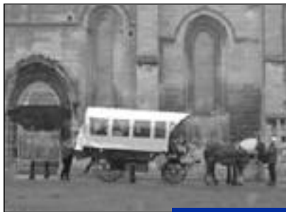
Comme au moyen-âge.

La calèche, tirée par deux magnifiques chevaux de trait de race comtoise, peut transporter de dix à douze passagers.