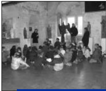
La plupart des animations du musée s'adresse au jeune public.

Le 28 mars, une fois les beaux jours revenus, le musée de l'archerie et du Valois rouvrira ses portes au public. Un lieu remarquable puisqu'il est installé dans l'ancien château des seigneurs de Crépy-Nanteuil, datant des 12 e et 13 e siècles, aux structures médiévales relativement bien conservées. Quant aux collections, elles sont également riches d'intérêt puisque en plus de présenter l'archerie dans le Valois et dans le monde, "un thème original et unique en France", souligne Eric Blanchegorge, conservateur, le musée regroupe également une grande partie de la statuaire des églises du Valois. Les tarifs d'entrée au musée sont volontairement bas pour que le plus grand nombre puisse accéder à ces trésors d'histoire. La réouverture des lieux marque également le début d'un nouveau cycle d'animations mises en place par le personnel du musée. En plus d'un catalogue d'animations pédagogiques proposé par le musée aux établissements scolaires, de la primaire au lycée, pour faire découvrir aux élèves la vie au Moyen Age ainsi que l'histoire de la pratique de l'arc dans le monde, l'équipe du musée organise des