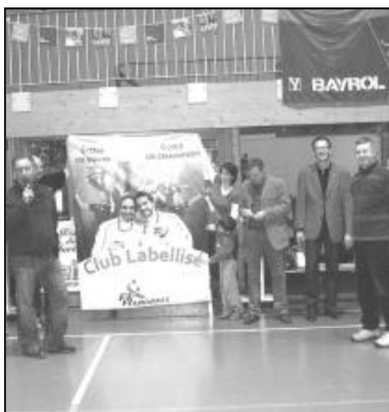
Le club de handball a reçu de la fédération départementale le label école de handball argent.