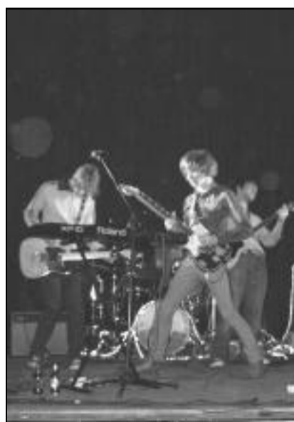
Ambiance rock'n roll au concert de l'assoc' au bœuf du 7 février