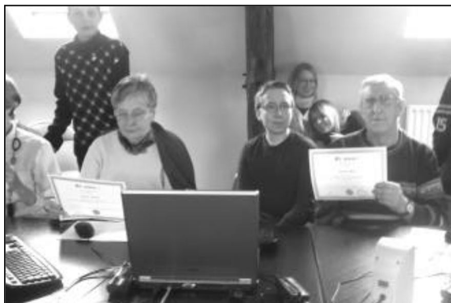
Suite à projet du conseil général sur le thème "jeunes et vieux connectez vous", les résidents des maisons de retraite de Crépy ont passé le B2i, brevet informatique et internet, grâce à l'aide des jeunes du conseil municipal de la ville.